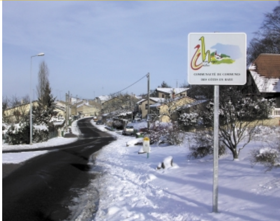
Pose de panneaux intercommunaux.

Pour les autres villages, il semblerait que l’on puisse passer directement à la phase « travaux ».