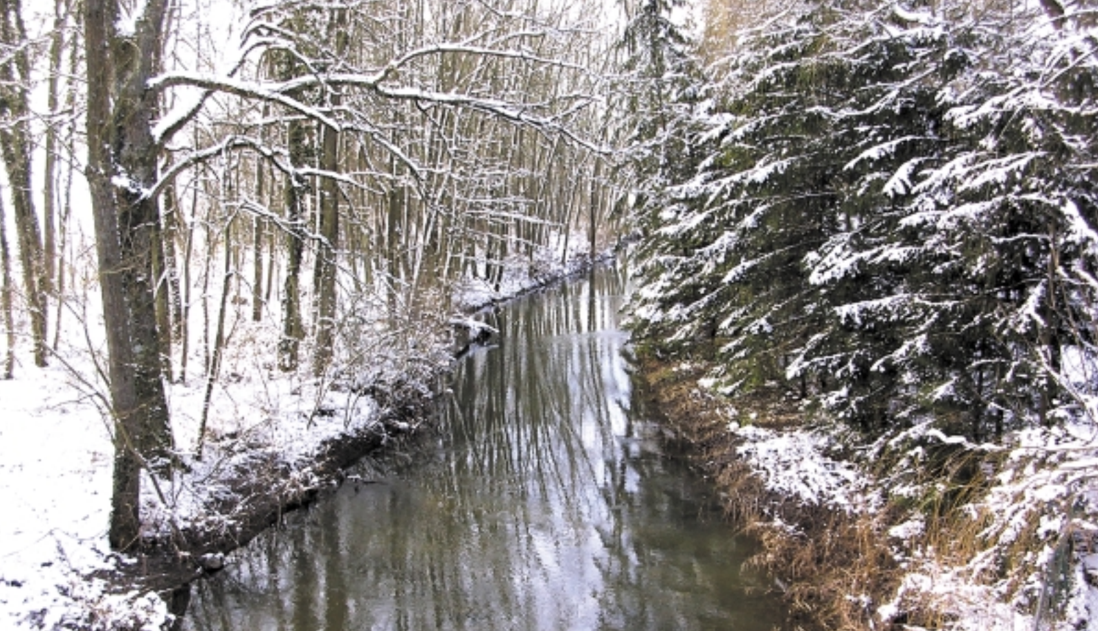
Restauration du ruisseau d'Esch