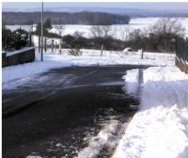
Déneigement des voies communales.