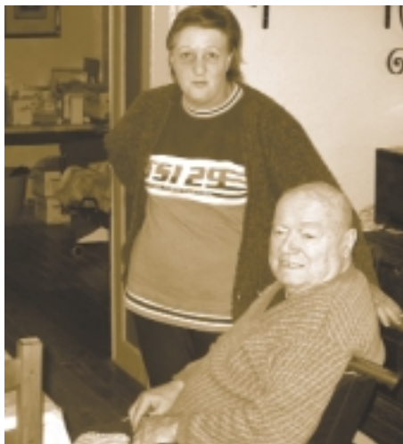
La livraison alimente aussi les relations.

200 km de route, c'est ce qu'effectue chaque jour la camionnette réfrigérée du Centre Multi-Services pour porter les repas au domicile de ceux pour qui la vie quotidienne est freinée par des problèmes de santé ou de mobilité.